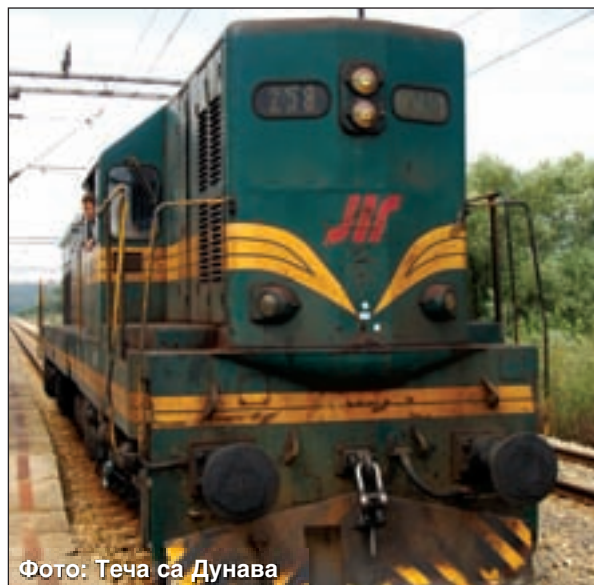
Фото: Теча са Дунава